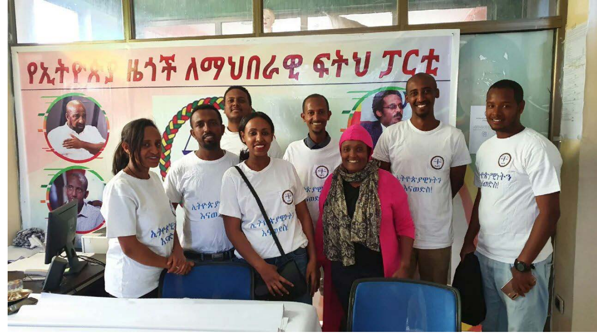
ምርጫ ወረዳ 24 ሥራ አስፈጻሚ መኝና እንዴት ተዋቀረ?

በዛሬው የቅንብር አምዳችን ስር ምርጫ ወረዳ 24ን እንቃኛለን። ምርጫ ወረዳ 24 በሥሩ ልዩ ወረዳ ተብሎ የሚጠራውን ልዩታን ጨምሮ 11 ወረዳዎችን አቅፎ የያዘ ሲሆን በሥሩም 249 የምርጫ ጣቢያዎች ይገኛሉ። ወረዳው በአሁኑ ሰዓት ከ300 በላይ አባላት አሉት። ምርጫ ወረዳው አየር ጤና መገርቱ ሕንፃ አንደኛ ፎቅ ላይ ቢሮውን ከፍቶ በመንቀሳቀስ ላይ ይገኛል። በዛሬው የቅንብር አምዳችን ምርጫ ወረዳ 24ን በጨረፍታ እንመለከታለን። ምርጫ ወረዳውን በሚመለከት አስፈላጊውን መረጃ ያቀበሉንን የምርጫ ወረዳው ሕዝብ ግንኙነት ኃላፊን በአንባቢዎቻችን ስም እናመሰግናለን።