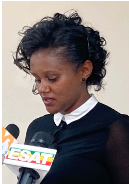
ፓርቲው ከሌሎች ፓርቲዎች በተለየ ለሴቶች እና ለአካል ጉዳተኞች ከፍተኛ ትኩረት ሰጥቶ እየሰራ እንደሚገኝ የጠቆሙት ተጠሪዋ።

ኢ.ዜ.ማ በ2013 ዓ.ም በሚደረገው ሀገር አቀፍ ምርጫ በብቃት አሸናፊ ሆኖ ለመወጣት በየወረዳው ዕጩ ተወዳዳሪዎችን በወረዳ ደረጃ እያስመረጠ የሚገኝ ሲሆን፣